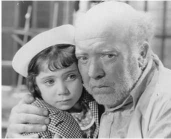
1936 THE CAPTAIN'S KID de Nick Grinde avec Sybil Jason