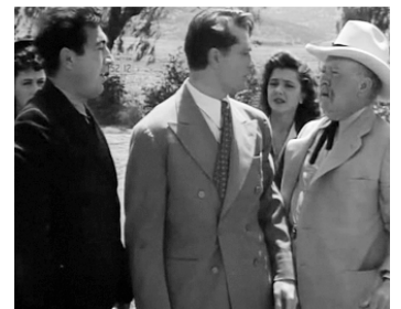
1942 L'AFFAIRE DU FORT DIXON (Whistling in Dixie) de S. Sylvan Simon avec R. Skelton