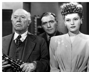
1945 THE HORN BLOWS AT MIDNIGHT de Raoul Walsh avec Jack Benny, Alexis Smith