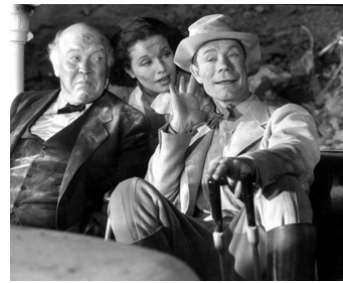
1936 EARTHWORM TRACTORS de Ray Enright avec June Travis, Joe E. Brown