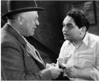
1932 DEUX SECONDES (Two Seconds) de Mervyn LeRoy avec Edward G. Robinson