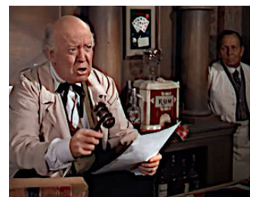
1948 LE FILS DU DÉSERT (Three Godfathers) de John Ford