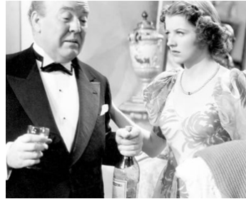
1937 MAMA STEPS OUT de George B. Seitz avec Betty Furness