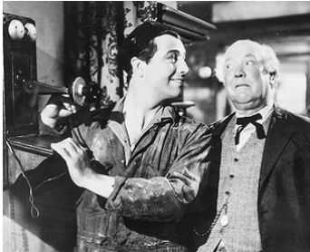
1938 TROIS CAMARADES (Three Comrades) de Frank Borzage avec Robert Taylor