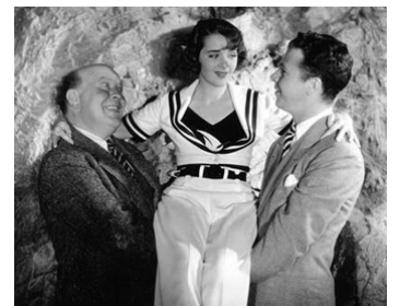
1934 DAMES (Dames) de Ray Enright avec Ruby Keeler, Dick Powell