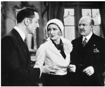
1931 MAN OF THE WORLD de Richard Wallace avec William Powell, Carole Lombard