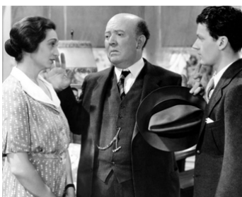
1934 BIG HEARTED HERBERT de William Keighley avec A. MacMahon, Junior Durkin