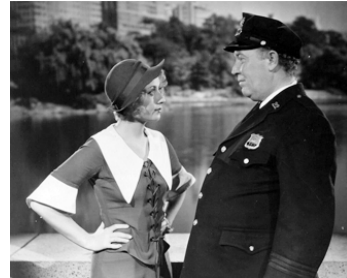
1932 NUIT D'AVENTURES (Central Park) de John G. Adolphi avec Joan Blondell