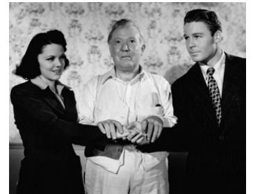
1941 SCATTERGOOD BAINES de Christy Cabanne avec Carol Hughes, John Archer