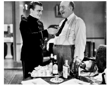
1931 BLONDE CRAZY (Blonde Crazy) de Roy Del Ruth avec James Cagney