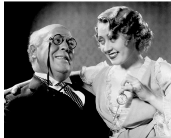
1933 CHERCHEUSES D'OR DE 1933 (Gold Diggers of 1933) de Mervyn LeRoy avec Joan Blondell