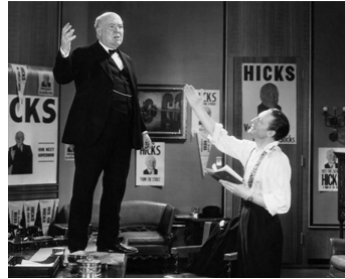
1932 THE DARK HORSE d'Alfred E. Green avec Warren William