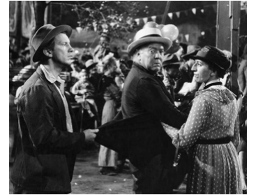
1937 JUSTICE DES MONTAGNES (Mountain Justice) de M. Curtiz avec F. Knight, M. Hamilton