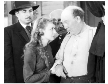
1936 M'LISS de George Nicholls Jr avec Douglas Dumbrille, Ann Shirley