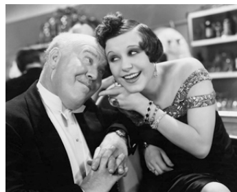
1934 WONDER BAR (Wonder Bar) de Lloyd Bacon avec Fifi d'Orsay