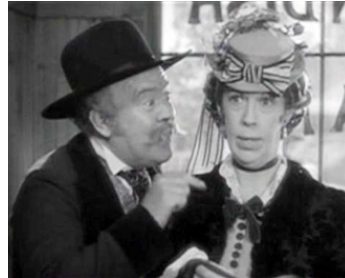
1932 LES CONQUÉRANTS (The Conquerors) de William A. Wellman avec Edna May Oliver