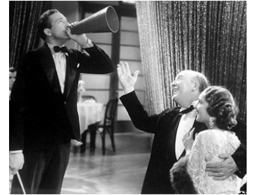
1932 CROONER de Lloyd Bacon avec David Manners, Ann Dvorak