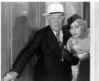
1933 LA FOLLE SEMAINE (Convention City) d'Arthie Mayo avec Joan Blondell