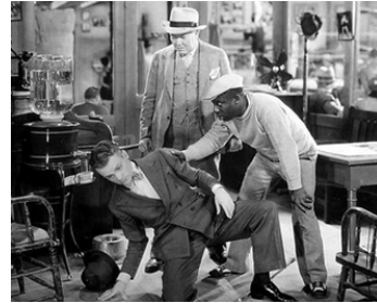
1932 WINNER TAKE ALL de Roy Del Ruth avec James Cagney, Clarence Muse