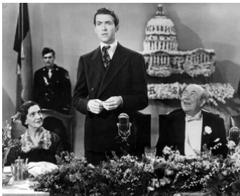
1939 M. SMITH AU SÉNAT (Mr Smith goes to Washington) de F. Capra avec James Stewart