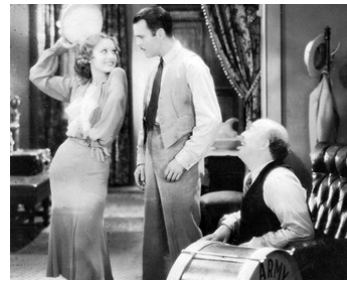
1931 LA PÉCHERESSE (Laughing Sinners) d'Harry Beaumont avec Joan Crawford, Neil Hamilton