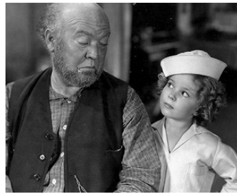
1936 CAPITAINE JANVIER (Captain January) de David Butler avec Shirley Temple