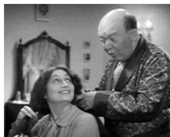
1934 BABBITT de William Keighley avec Aline MacMahon