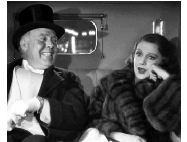
1933 42 e RUE (42nd Street) de Lloyd Bacon avec Bebe Daniels