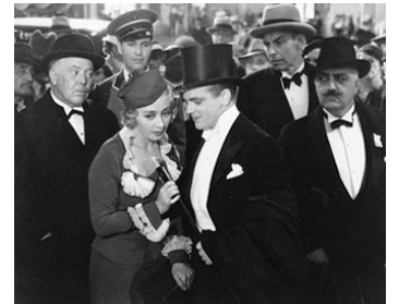
1933 PROLOGUE (Footlight Parade) de Lloyd Bacon avec Joan Blondell, James Cagney