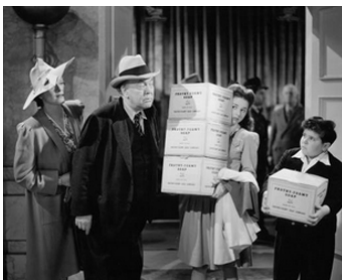
1942 THIS TIME FOR KEEPS de Charles Reisner avec Irene Rich, Ann Rutherford