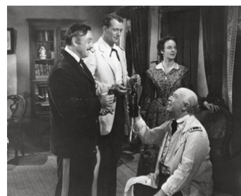
1948 LE MASSACRE DE FORT APACHE (Fort Apache) de J. Ford avec E. O'Brien, J. Wayne