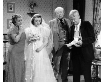
1938 THREE LOVES HAS NANCY de R. Thorpe avec Emma Dunn, J. Gaynor, Ch. Grapewin