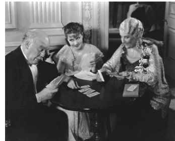
1933 GRANDE DAME D'UN JOUR (Lady for a Day) de Frank Capra avec Jean Parker, Flora Robson