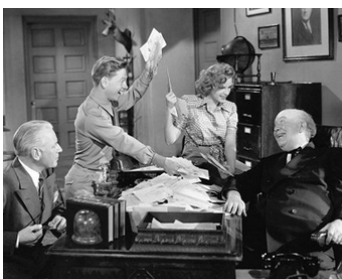
1943 FOU DE GIRLS (Girl Crazy) de N. Turog avec Henry O'Neill, M. Rooney, J. Garland