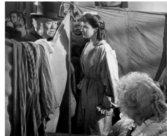
1940 LA BELLE ÉCUYÈRE (Chad Hanna) d'Henry King avec Linda Darnell