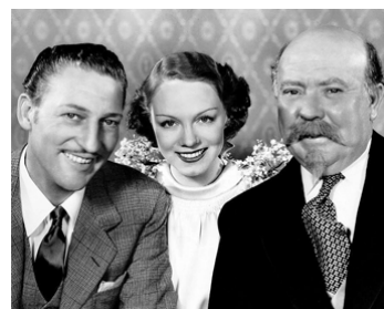
1935 DON'T BET ON BLONDES de Robert Florey avec Warren William, Claire Dodd