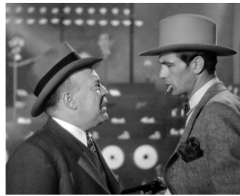
1931 LES CARREFOURS DE LA VILLE (City Streets) de R. Mamoulian avec Gary Cooper